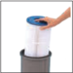
Elemento filtrante de fácil desmontaje