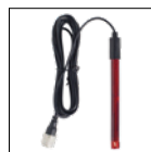
Kit sonda de Redox Estándar