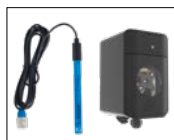
Kit pH Estándar