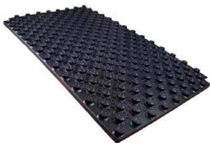
Placa de nopas 26 TérmicaStark